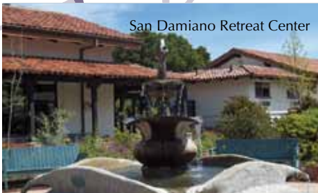
San Damiano Retreat Center

Comité de Educación y Servicios e-Boletín • Junio 2009